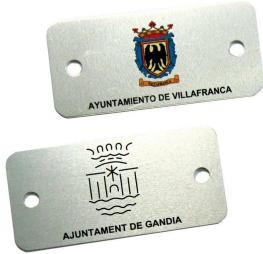
Plaqueta aluminio 74 x 35 mm.