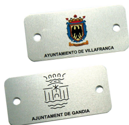
Plaqueta aluminio 74 x 35 mm.