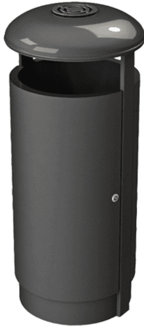
DAMBIS SOLO 150