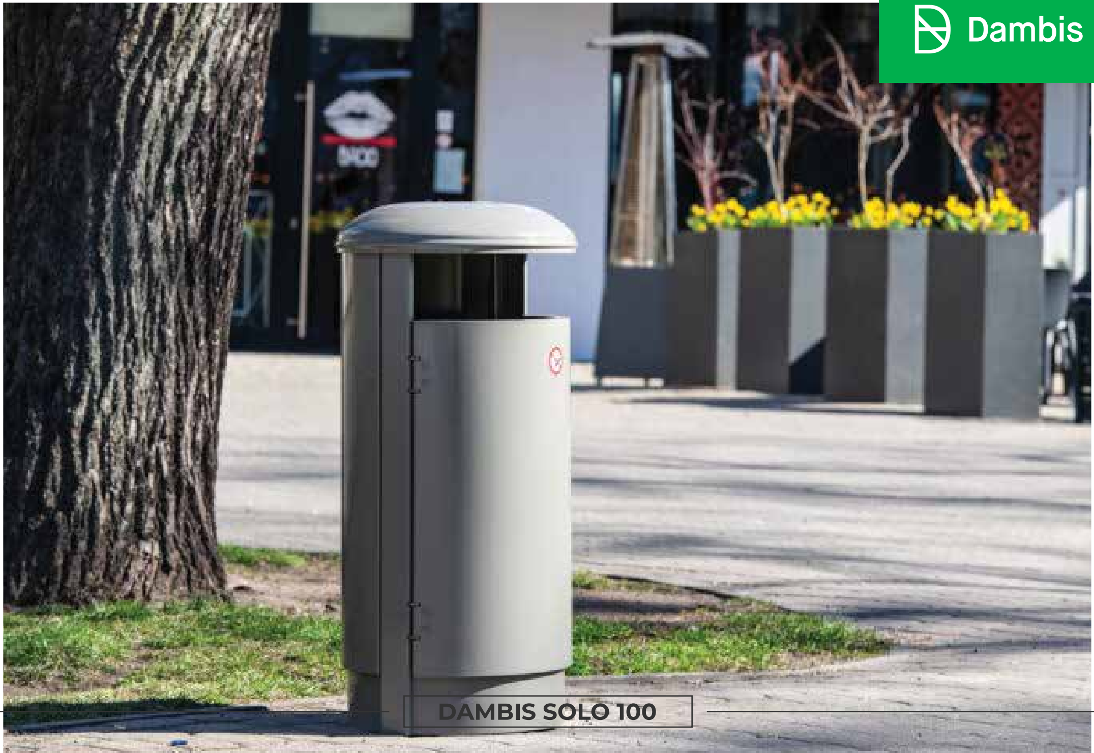
DAMBIS SOLO 100