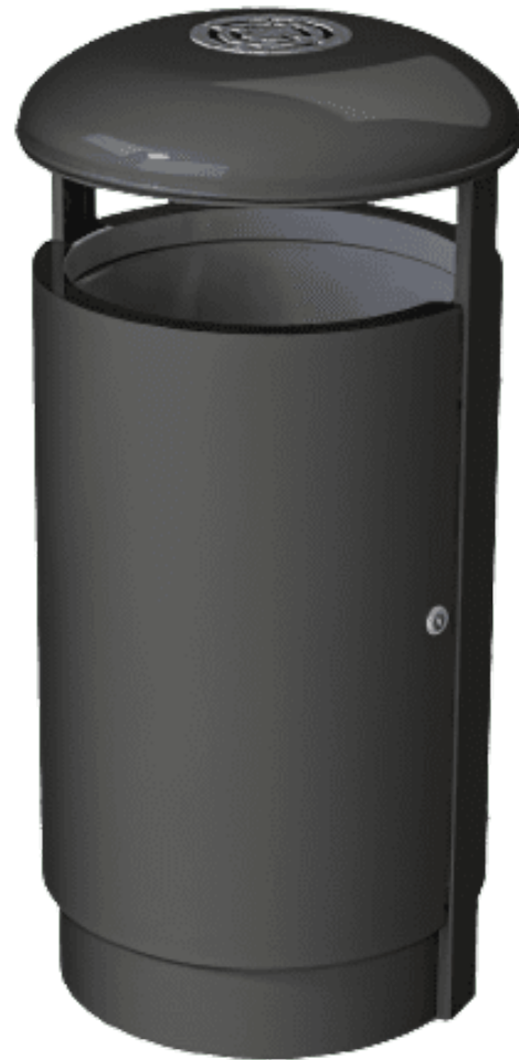
DAMBIS SOLO 100